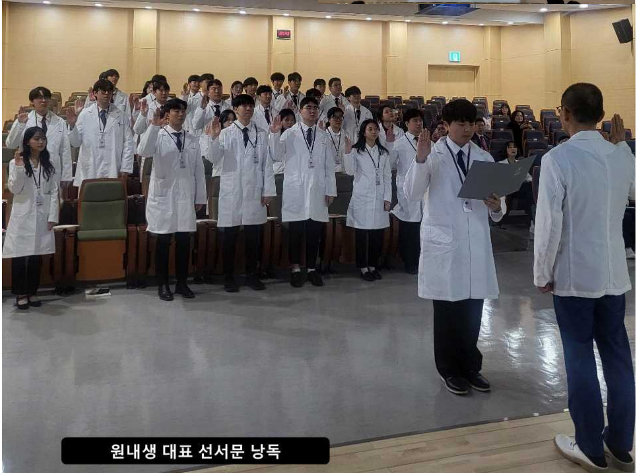
원내생 대표 선서문 낭독