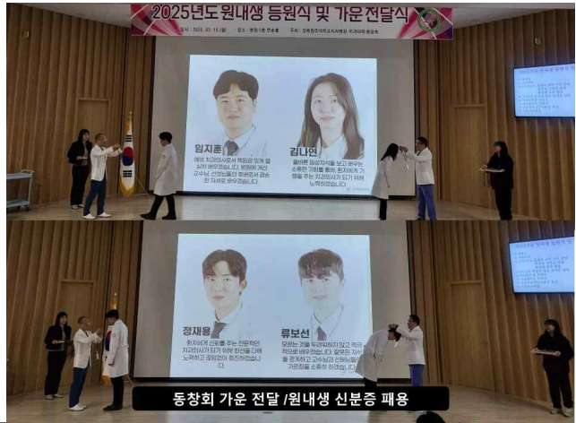
동창회 가운 전달 / 원내생 신분증 패용