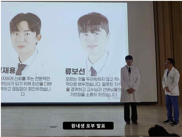
원내생 포부 발표